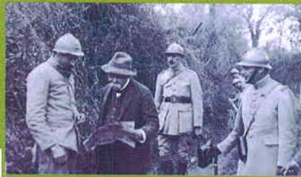
Visite du Président du Conseil G. Clémentel au Plémont en 1917

Un an après leur départ, les Allemands sont de retour. La défense de la butte du Plémont devient alors un enjeu stratégique pour les Français, avec comme objectif de ralentir l'avancée allemande. Le 9 juin 1918, l'offensive allemande reprend dans l'Oise et les Allemands enlèvent le massif du Plémont après pas moins de quatorze assauts successifs, ils y resteront jusqu'en août 1918.