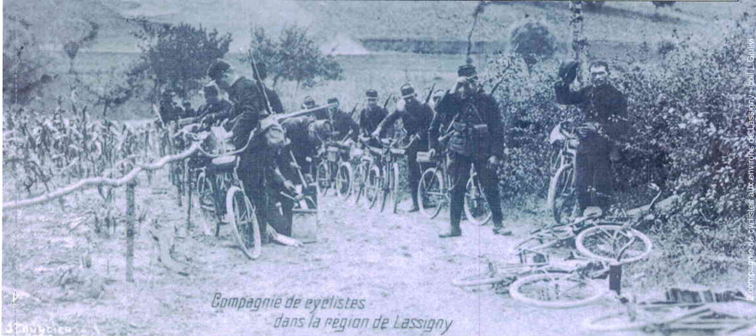
Compagnie de cyclistes dans la région de Lassigny